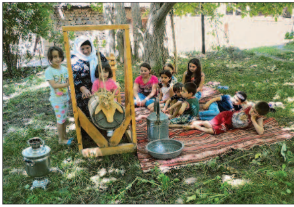
"Ailə dəyərlərimiz film və fotolarda" mövzusunda keçirilən müsabiqəyə (2018-ci il) təqdim olunan foto.

Tarixən milli-mənəvi dəyərimizin saxlanacağı yeri olan ailənin əsas atributları valideynlər hesab edilir. Çünki valideyn böyük hörmət sahibi, ailə məsələlərinin həlledicisidir. Valideyn statusuna malik olan üzvlər tarixən ailə dəyərlərinə sahib çıxan, onu təbliğ edən nümayəndələr olub-